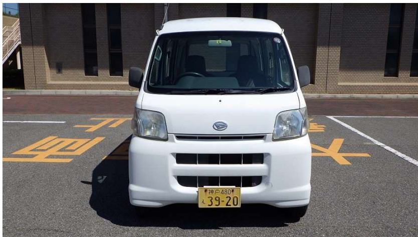
神戸 480 え 3920