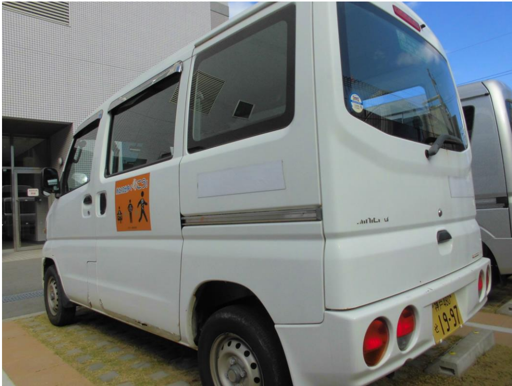
三菱 ミニキャブ・バン(神戸 480 せ 1997)