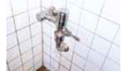
海岸や公園のトイレの破損

海岸や公園のトイレの破損や、道路の穴ぼこを発見したら写真や位置情報をつけて簡単に通報できます。