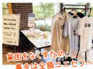
貧困をなくすため、募金は全額ユニセフへ

印刷工程で発生したあまり紙をメモ帳や便せんなどに再利用し、ユニセフ募金をしてくれた人にプレゼントする「あまり紙でつながろうプロジェクト」を実施しています。