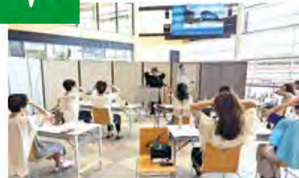
化粧品は考えながら、手を動かすのでフレイル予防にもつながりますよ。

地域の人が出外するきっかけづくりのために、「美と健康」をテーマに講座を開催しています。フレイル予防教室では、一人でできるヘッドマッサージの仕方などを伝えています。すべての人が自分らしく自己実現できるように「ジェンダーレスメイク教室」も開催しました。