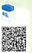
骨太レシピはこちらから