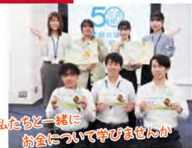
私たちと一緒に お金について学びませんか