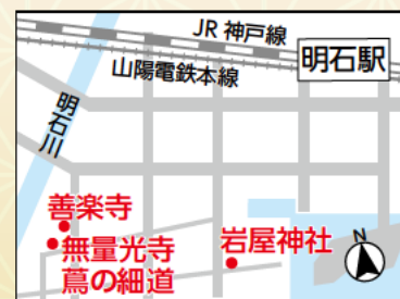
ゆかりの場所マップ