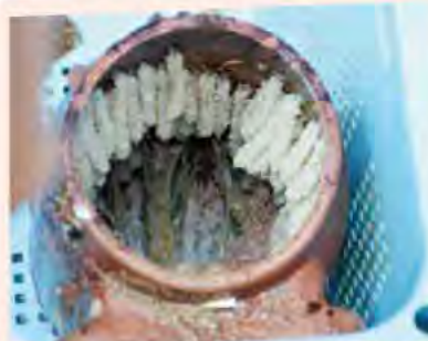
産卵用たこつぼに産みつけられたタコの卵

タコは岩場の穴や隙間など狭い場所を好みます。産卵しやすい場所を増やすために、産卵用たこつぼの投入を1966年から50年以上続けています。