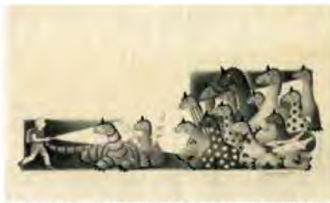
『エルマーと16ぴきのりゅう』原画(1951年)

『エルマーのぼうけん』3部作の原画や資料を西日本で初公開!体験型の展示で、本とはまた違う形で子どもから大人まで物語の世界を味わうことができる展覧会です。 期間/5月19日(日)までの午前9時30分～午後6時30分(入館は午後6時まで) ※会期中無休 観覧料/大人1000円、大高生700円(中学生以下無料)、障害者手帳などの提示で半額