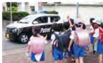
王子小学校保護者の活動の様子