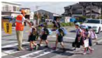
オレンジ色の帽子が目印

約4000人の地域の方が、市内の全28小学校区で登下校時の見守りやあいさつ運動を行っています。