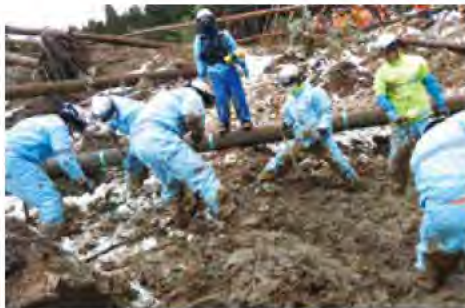
土砂崩れの現場で救助活動を行う消防隊(輪島市)

令和6年能登半島地震で甚大な被害が発生している地域の災害活動応援のため21隊74人の消防職員を派遣しました。