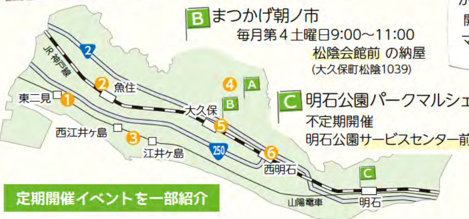
定期開催イベントを一部紹介