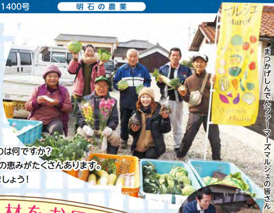
まつかげしんでんファーマーズマルシェの皆さん

「明石産の食材」といえば思い浮かべるものは何ですか? タコやタイ、アナゴなど海の幸に加えて陸の恵みがたくさんあります。 明石ならではの新鮮な食材を味わってみましょう!