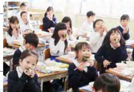
明石のりを使った節分給食(人丸小学校)