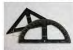
三角定規と分度器

午前9時30分～午後5時30分(入館は午後5時まで) ※月曜日休館 観覧料/大人200円、大高生150円(中学生以下無料)、障害者手帳などの提示で半額