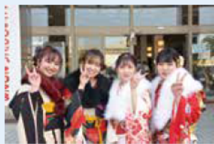
友人と笑顔で再会

お問い合わせ/青少年教育担当(TEL 918-5057 FAX 918-5155)