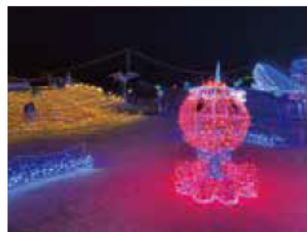
パパたこのオブジェも新登場