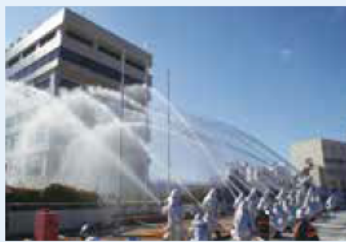
消防団による迫力ある放水

場所/市役所北側、市民会館 内容/▷午前10時~式典 ▷午前11時~入場行進、子ども消防隊パレード ▷午前11時30分~救助隊演技、消防団一斉放水演習 ▷消防車両展示コーナー(午前10時~10時45分) ※雨天時は式典のみ