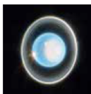
©NASA, ESA, CSA, STScI. Image processing J. DePasquale (STScI)

天王星は自転軸が98度も傾いた状態で太陽の周りを公転しています。天王星と、天王星の発見について紹介します。