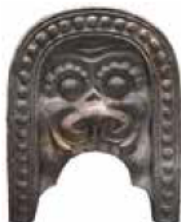
鬼瓦(林崎三本松窯)

江戸時代から明治時代の明石焼を焼いた窯から出土した陶器などを展示し、明石の地で焼かれたやきものを通して当時の社会・文化を紹介します。