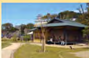
明石公園にある武蔵の庭園