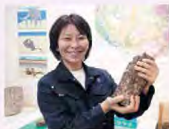
展示についての質問にスタッフが応えます