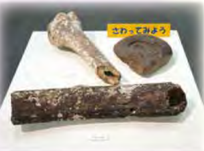
朝霧や明石川周辺で採集された貝化石の展示も