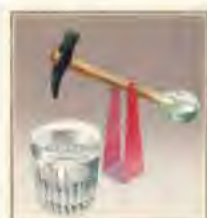
「水飲み鳥」[空想工房の絵本]より 2014年©空想工房 画像提供:津和野町立安野光雅美術館

期間/8月27日(日)まで 午前9時30分～午後6時30分(入館は午後6時まで) ※会期中無休 観覧料/大人1000円、大高生700円(中学生以下無料)、障害者手帳などの提示で半額