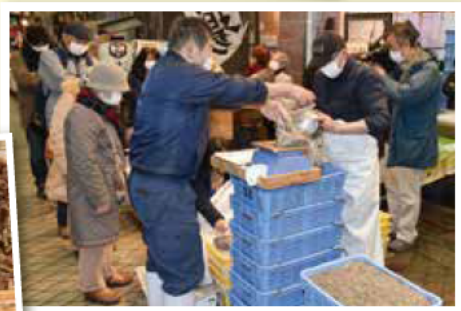
魚の棚商店街には朝早くからイカナゴを求める人の行列が