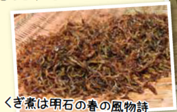
くぎ煮は明石の春の風物詩

①エ ②ア (△△)③④⑤⑥⑦⑧⑨⑩⑪⑫⑬⑭⑮⑯⑰⑱⑲⑳㉑㉒㉓㉔㉕㉖㉗㉘㉙㉚㉛㉜㉝㉞㉟㊱㊲㊳㊴㊵㊶㊷㊸㊹㊺ [㊻㊼]