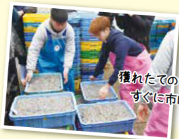
獲れたてのシンコはすぐに市内のお店へ