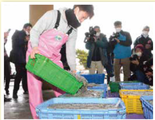
かごいっぱい詰められた新鮮なシンコ