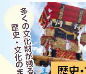
多くの文化財が残る歴史・文化のまち