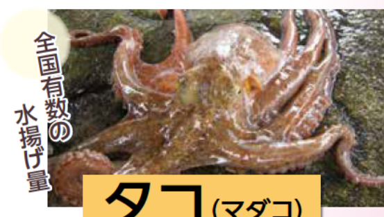
全国有数の水揚げ量