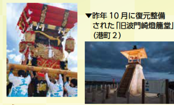
▼昨年10月に復元整備された「旧波門崎燈籠堂」(港町2)

目の前に明石海峡を臨む「海のまち明石」。昨年11月には全国豊かな海づくり大会が明石市をメイン会場に開催され、明石の海の魅力を全国に発信しました。