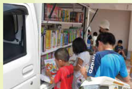
▲移動図書館車 2台で本をお届け

「いつでも どこでも だれでも 手を伸ばせば本に届くまち」を目指すまちづくりが進み、まちなかで本と出合える場所が増えています。