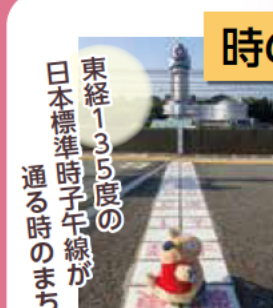
東経135度の日本標準時子午線が通る時のまち