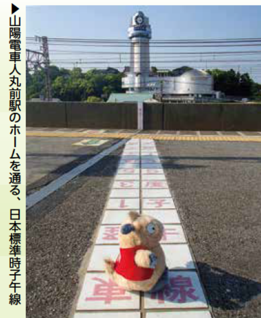
山陽電車丸の内線を通る、日本標準時子午線

子育て世代の転入が増加している明石市。医療費無料化やおむつ定期便をはじめとする子育て支援策は新たな明石ブランドです。