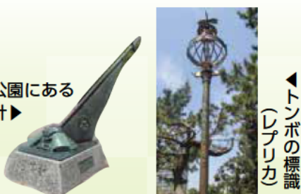
鐘の音のポスター(セシル)

東経135度の日本標準時子午線が通る「時のまち」明石。市内には天文科学館をはじめ、時や子午線にまつわる標識やモニュメントがたくさんあります。