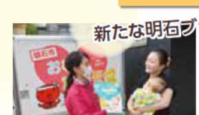
新たな明石ブランド