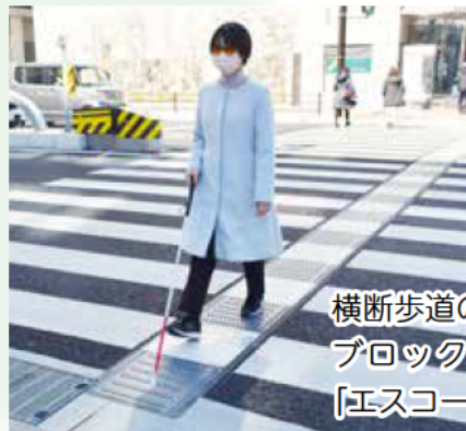
横断歩道の中央に点状ブロックを設置した「エスコートゾーン」