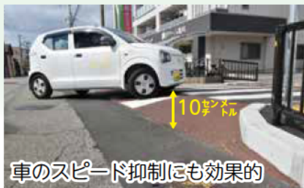
車のスピード抑制にも効果的