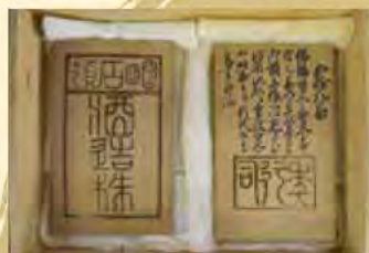
延宝7年(1679年)発行の 明石領酒造株の鑑札 (江井ヶ嶋酒造保管)

明石の酒造りの始まりは、 江戸時代初期(延宝年間 (1673年~1681年))に、 江井島のト部八兵衛が 領主の許可を得て醸造を 始めた、とされています。