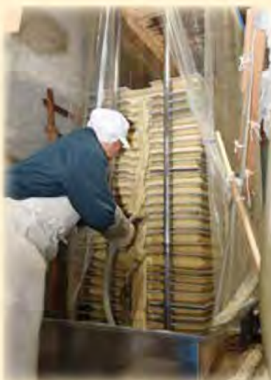
醪を袋に詰めて圧搾機で搾る 酒の搾り方も各蔵さまざま