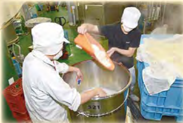
こうじ もろみ 米・麴・水を混ぜ合わせて酒母や醪をつくる