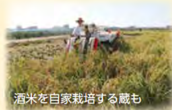
酒米を自家栽培する蔵も