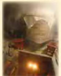
こしき 直火で米を蒸す昔ながらの甑