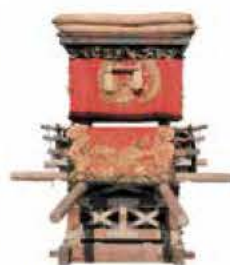
ほたて 穂蓼八幡神社・布団太鼓

期間／12月16日(木)～1月16日(日)午前9時30分～午後6時30分(入館は午後6時まで) ※月曜日と12月29日～1月3日休館(1月10日は開館) 観覧料／大人200円、大高生150円 ※障害者手帳などの提示で半額