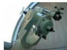
16階天体観測室の反射望遠鏡

日時／①1月8日(土)、②1月29日(土) いずれも午後7時～8時15分(受け付け午後6時30分～) 定員／各20人 料金／1人300円(駐車料金別途200円) 申し込み／①12月25日、②1月15日午後5時まで同館ホームページで受け付け。応募多数時抽選 ※ホームページから申し込みができない場合は電話でお問い合わせを