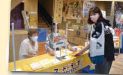
フードドライブを実施。食品ロス削減とごみの削減に取り組んでいます。 取り組み団体: コープこうべ第6地区本部

あかしSDGsパートナーズやSDGsに関する相談窓口はこちら SDGs推進室 (TEL)918-5010 (FAX)918-5101)