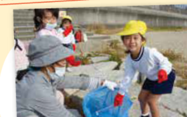
藤江幼稚園の子どもと力を合わせて藤江海岸を清掃 取り組み団体: 海と空の約束プロジェクト