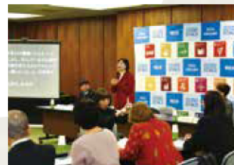
2020年2月3日に開かれた第1回「あかしSDGs推進審議会」