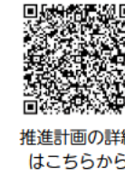
推進計画の詳細はこちら

申し込み/①・③は開催日1週間前の午後5時まで、②・④は開催日5日前の午後5時までに電話・ファクシミリ・メール(氏名、電話番号などの連絡先、希望日時を記入)でSDGs推進室(TEL)918-5010 (FAX)918-5101 (E)seisaku@city.akashi.lg.jp)へ。応募多数時抽選 ※多くの人が参加できるように、お一人1回の申し込みをお願いします。