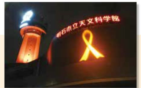
プラネタリウム長寿日本一の天文科学館 今月は児童虐待防止の啓発として 11日までオレンジイルミネーションが点灯

前回の国勢調査から、市の人口が 3.55%増加し、中核市62市の中で 増加率が第1位になりました。