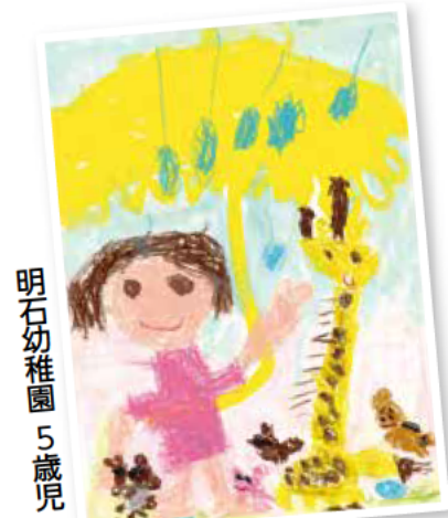
「ちいさなきいろいかさ」金の星社にしまき かやこ イラスト/もりひさし シナリオ

※掲載している作品は昨年度の代表作品です。また、学年・年齢は応募当時のものです。