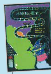
「なぜか水曜日に現れる不思議な魔女!!」フレーベル館 ルース・チュウ 作 日当 陽子 訳/たんじ あきこ 絵