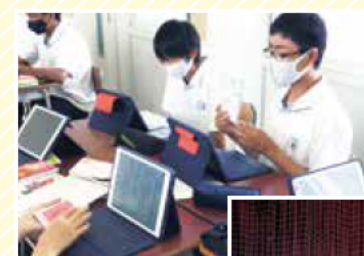
◀みんなの前でおススメの1冊を紹介(二見中学校)

児童・生徒が本を紹介しあい、一番読みたいと思う本を投票で選ぶ取り組みを一部の小・中学校で実施。ほかの人の考えを理解する力・自分の考えを伝える表現力を養います。