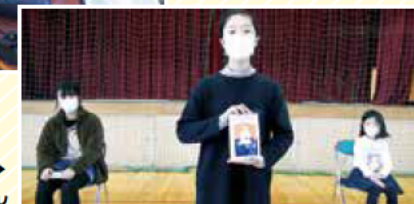
王子小学校のチャンピオンの皆さん