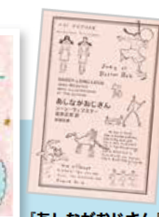
「あしながおじさん」新潮社(新潮文庫) ジーン・ウェブスター 著 岩本 正恵 訳