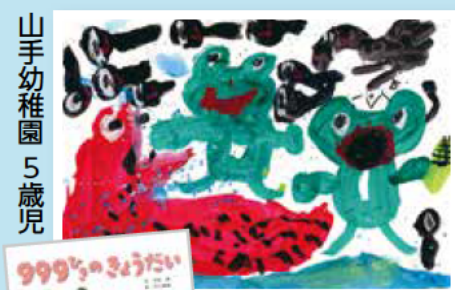
「999のきょうだい」ひさかたチャイルド 木村 研文/村上 康成 絵