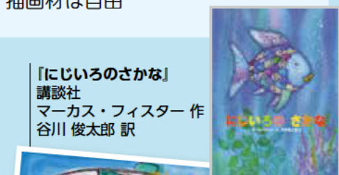
「にじいろのさかな」講談社 マーカス・フィスター 作 谷川 俊太郎 訳