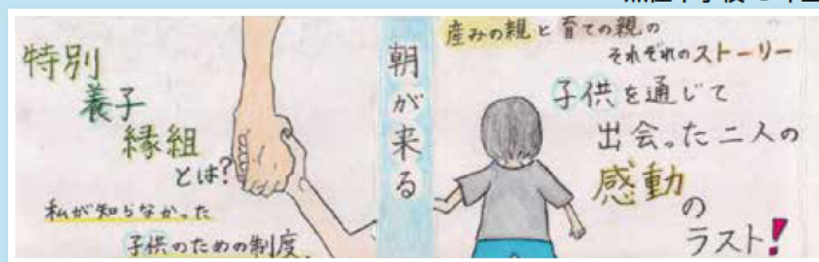
「朝が来る」文春文庫 辻村 深月 著