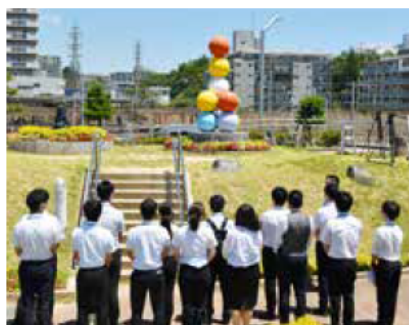
慰霊碑の前で黙とうを行う 入庁1年目の職員