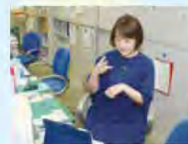
私たちが対応します

聴覚に障害のある人が、アプリ(フェイスタイム、スカイプ)のビデオ通話機能を使い、手話で市に問い合わせができるサービスがはじまりました。