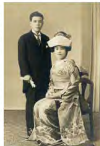
結婚当初の小林夫妻

家族や親戚から反対された人もいます。私たちは何も悪いことをしていない、間違っていないので恥ずかしいことはないと話合っ