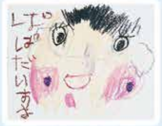
松の内 みいちゃんさん(5歳) パパ、いつもありがとう おしごとがんばってね♡