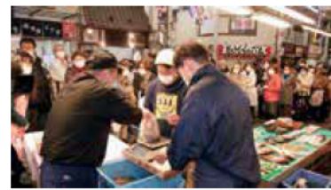
魚の棚商店街にはイカナゴを求める人の行列が

魚の棚商店街では、朝早くから買い物客が並び、シンコを購入した男性は「毎年購入しています。家で妻がくぎ煮を炊く準備をしているので急いで帰ります」と笑顔で話してくれました。