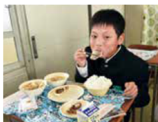
絶品の明石鯛に思わずかぶりつきます

明石のおいしい恵みに感謝し、1年を振り返りながら過ごす楽しいランチタイム。生徒の皆さんは「地元の素材が多くてうれしい」や「家ではあまり食べることがないタイがおいしかった」などと話してくれました。