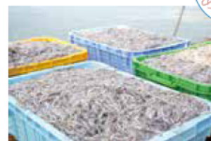
水揚げされたシンコ

春の訪れを告げるイカナゴ漁が3月6日、解禁されました。例年よりも少ないながら、水揚げされたシンコは新鮮なうちに市内の鮮魚店などへ出荷されました。