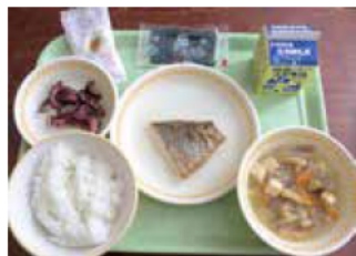
タコの煮つけ、タイの塩焼きなど海の幸が豊かな明石ならではの特別献立

3月5日、中学校給食に、明石海峡でとれたタコ・タイ・ノリを使った特別献立「あかしを食べよう」が登場しました。