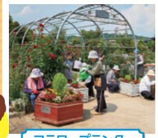
フラワープランター