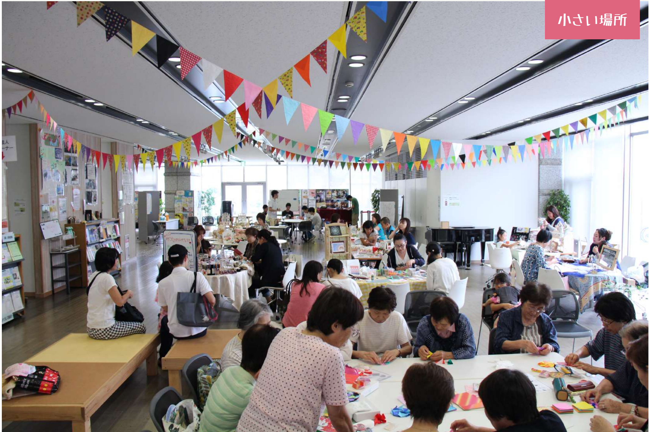
東播磨生活創造センターかこむ