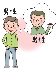
G ay ゲイ