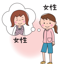
L esbian レスビアン