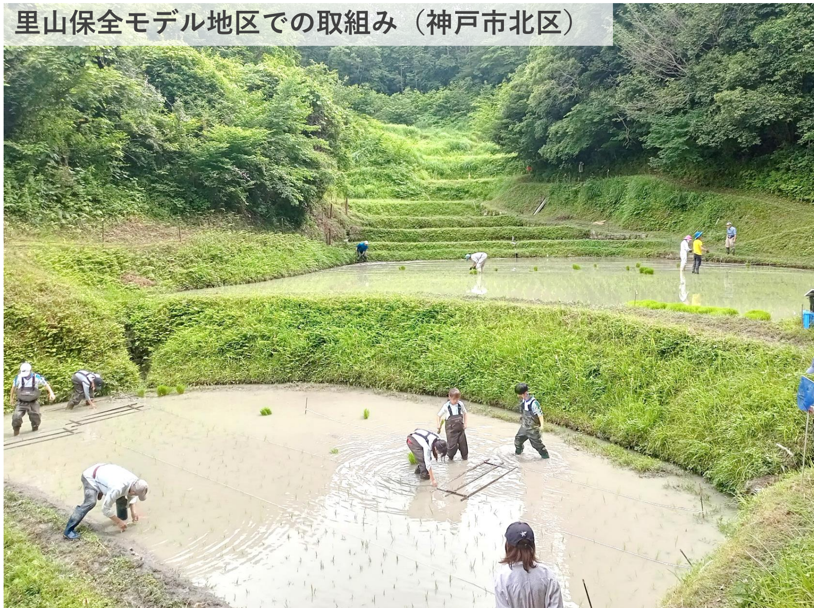
里山保全モデル地区での取り組み（神戸市北区）