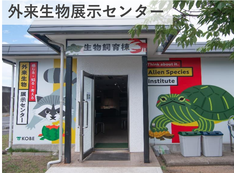
外来生物展示センター