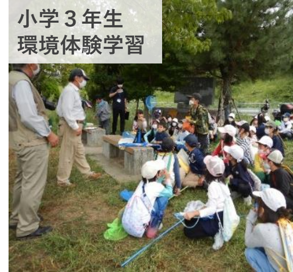
小学3年生 環境体験学習