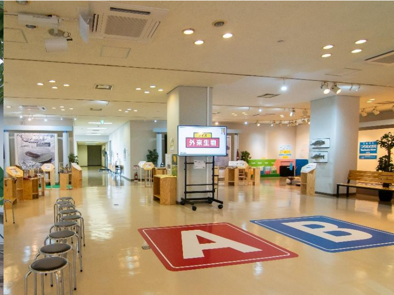
市民との協働による外来種対策