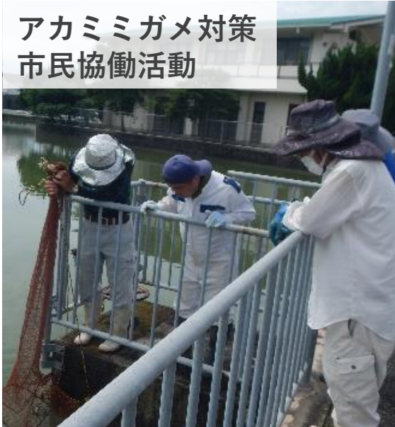
アカミミガメ対策 市民協働活動