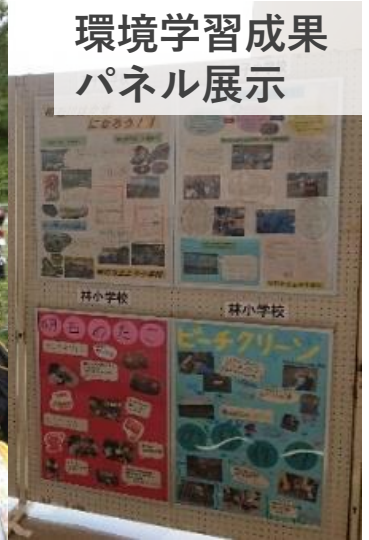
環境学習成果 パネル展示