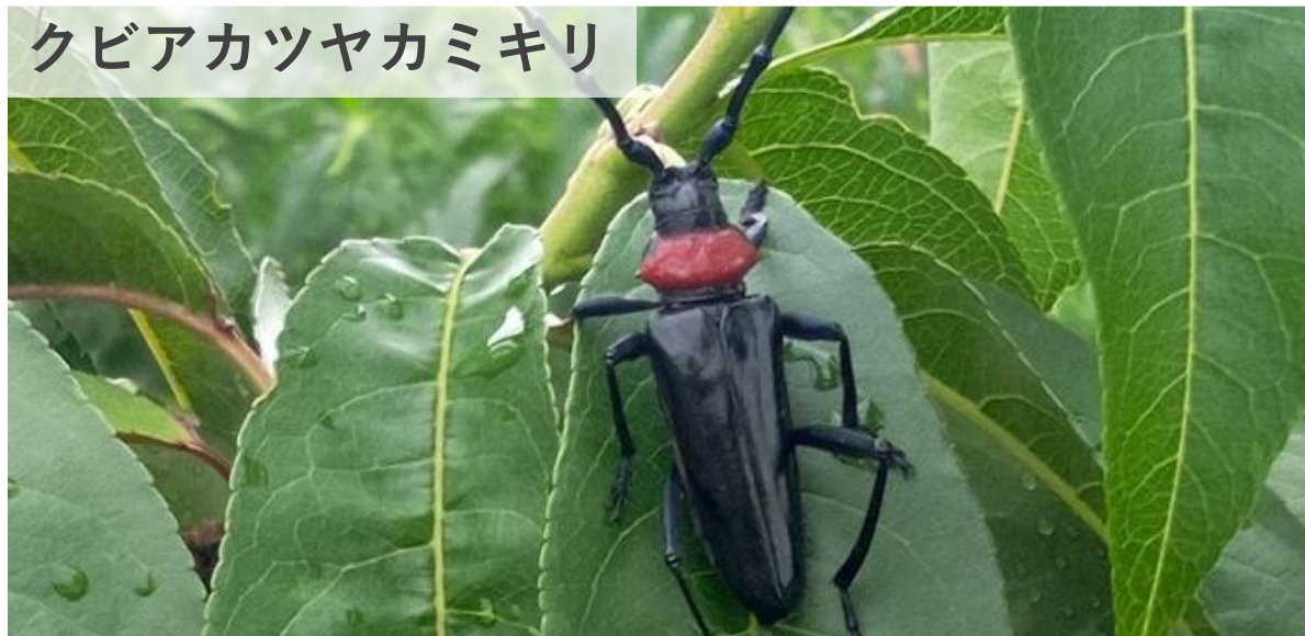
クビアカツヤカミキリ