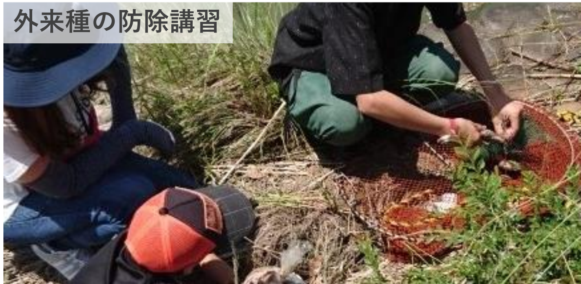
外来種の防除講習