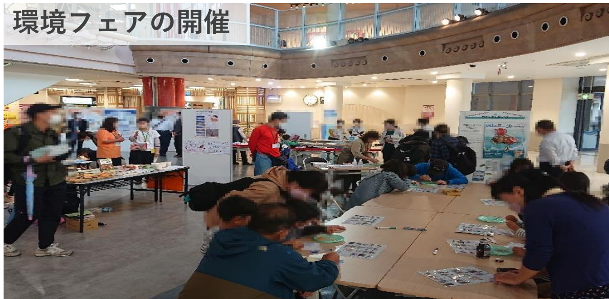
環境フェアの開催