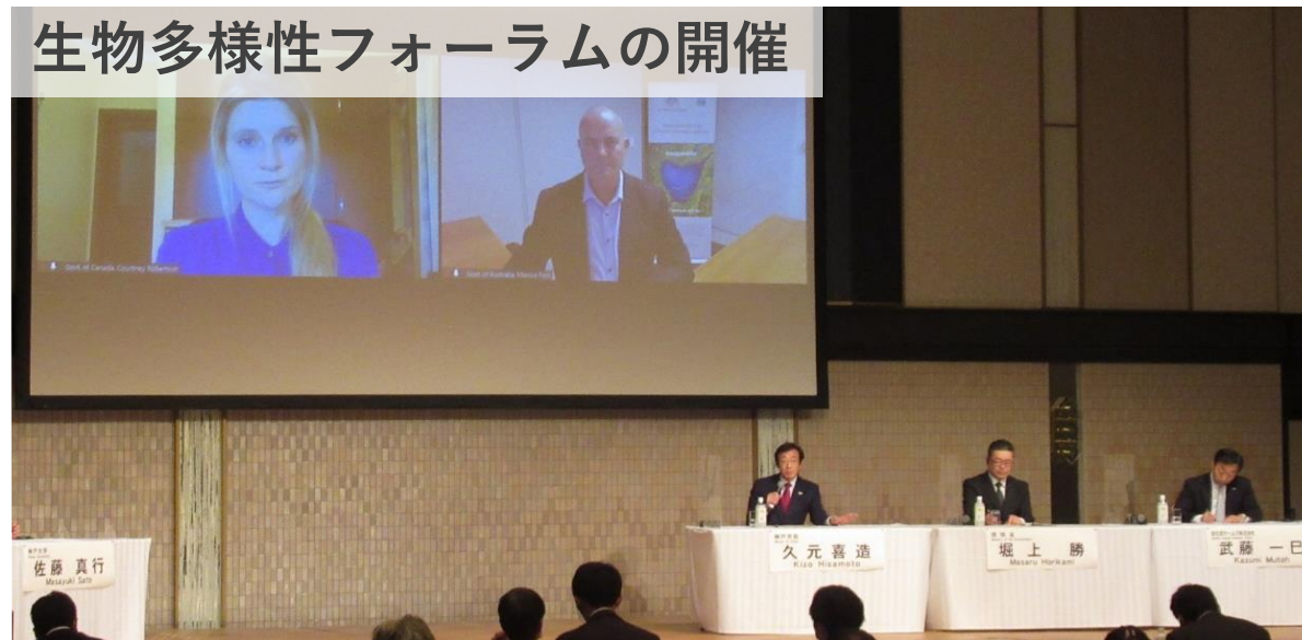
生物多様性フォーラムの開催