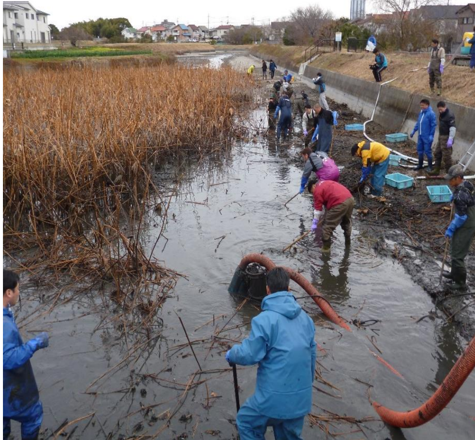
ため池のかいぼり 里と海の連携 (ため池協議会・漁協)