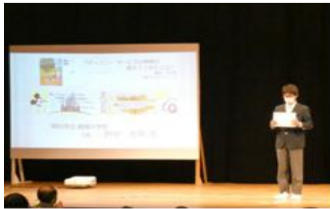
代表作品となった受賞者に表章状が授与されました。