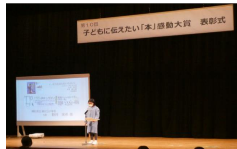
表章式において「作品への想い」が発表されました。