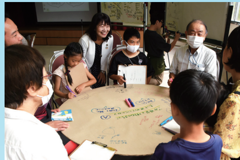
テーブルを囲んで和やかな雰囲気 (9/23 テーマ「環境～ごみ減量～」)