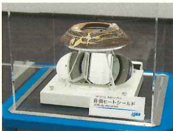
背面ヒートシールド(実物)