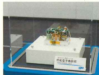
搭載電子機器部(実物)