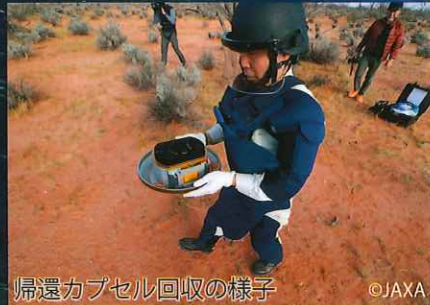
地球帰還 / カプセル分離

はやぶさ2は、小惑星リュウグウで困難なミッションを次々と成功させた探査機です。はやぶさ2のカプセルは、6年間・52億kmを旅し、2020年にリュウグウの砂などを地球に届けました。人類の宝である帰還カプセルを、この機会にぜひご覧ください。