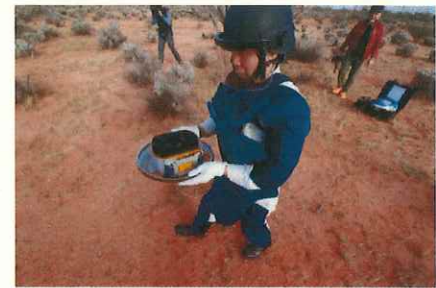
2020.12.6 帰還カプセル回収の様子 (オーストラリア)