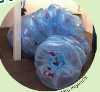
参考 kazuteru miyachi

ゴミ袋をみんなでふくらませて、自由につないででっかいタコに!? シールを貼ってカラフルにデザインしよう! どんなタコができるかな? 工作好きな人、この指とまれ!