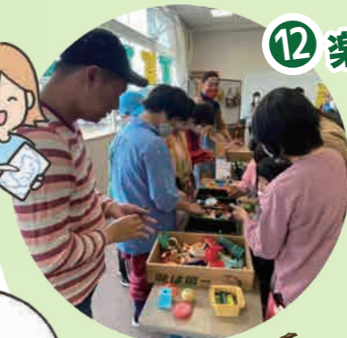
みんなで一緒に演奏しよう!

廃材を使って自分だけの楽器を作ってみませんか? 素材探しから始めて、楽器ができたら一緒に演奏しましょう!