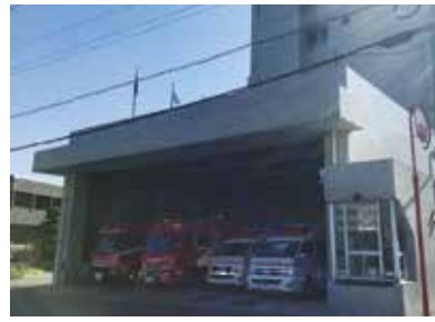
築50年が経過した中崎分署

新庁舎整備に合わせ、中崎遊園地への移転を予定している。今年9月4日から土質調査のためボーリング工事を行う予定であったが、市民団体から計画変更を求める要望書が提出されたため見合わせ、これまでの経緯を再確認した。これまで市民へ説明や意見聴取を行ってきたこと、移転先は歴史的価値の高いとされる場所から外れていないことを確認し、可能な樹木は移植することを決定し、工事の再開を指示した。