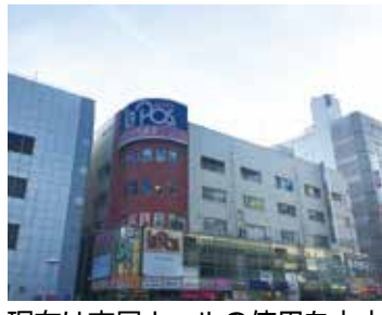
現在は市民ホールの使用を中止

ついては、市が5階部分を区分所有しているが、耐震性能の問題により市民ホールの使用を中止している。当ビルの大部分を所有している株式会社明石商工会館などは取り壊す方向で進めていると聞いているが、市としては、保有する権利を最大限活用し積極的に関わっていききたい。