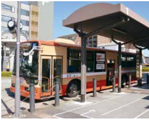
始発から満員になる場合も

貫教育校へは、校区外から70人程度の児童生徒が主にバスで通学している。バス路線は、2路線あり、高丘西小学校に通う児童は、岩岡に向かう路線、高丘東小学校や高丘中学校に通う児童生徒は、明石北高校を経由する路線を利用している。明石北高校を経由するバスは、本数が少なく、高校生も利用する。特に雨天時は満員となり、遅延