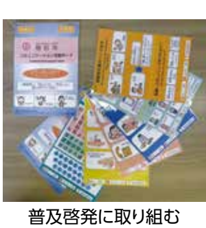
普及啓発に取り組む

意見書1件を可決し、政府・関係機関に送付しました。以下はその要旨です。 ◎女性デジタル人材育成を強力に推進するための支援を求める意見書 政府に対し、地方における女性デジタル人材育成の強力な推進を図るため、次の事項を実施するよう強く要望する。