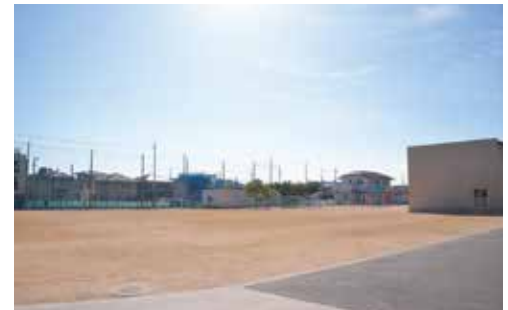
プレハブ校舎により運動場が狭小に

も発生している。現在、高丘小中一貫教育校と市教育委員会から児童生徒の乗車について、雨天時や混雑時の配慮を明石北高校へ引き続き協力を依頼