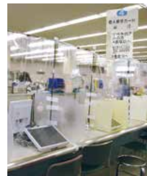
市民課のマイナンバー交付窓口

問 実施時期や期間などは。 答 事業の詳細は確定していないが、サポート利用券の利用期限が終了する6月30日以降に実施したい。経済動向を注視し、効果的なものになるよう検討する。