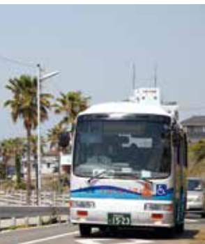
たこバスの利便性向上を

問 令和3年度のコミュニティバス(たこバス)運行補助金が約5千万円増額されているが、内訳は。 答 運行事業者の再公募により人件費・管理費を約2600万円増額したほか、車両の更新費が約1300万円、コロナ禍での利用者減少による減収補填費用が約1100万円となっている。