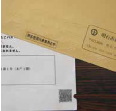
希望者には封筒に点字表記

答 希望者には封筒に点字表記をし、点字の説明文を同封するなど、個別の対応を行っている。また、ホームページに読み上げ機能を付け、チラシには、スマートフォンアプリで読み上げ可能なQRコード(音声コード)を印刷するなど