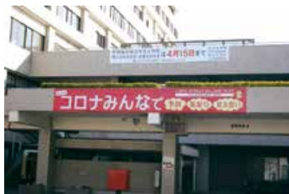
本市の感染症対策の基本方針を定める

止し、被害を受けた場合やその恐れのあるときは、救済を図るため必要な支援を行います。審査を行った文教厚生常任委員会では、委員から、差別があった際の具体的な対応について質問がありました。市からは、弁護士職員も入ったチームにより個々の事情に配慮した支援を検討していくとの答弁がありました。