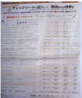
認知症チェックシート

問 広報あかしで啓発した認知症チェックシートの効果は。 答 令和3年3月1日時点で想定を上回る約2700人もの提出があった。そのうち認知症の疑いがあり、専門医受診を勧奨した割合は50%だった。認知症の不安を持つ人にとってチェックシートが受診のきっかけとなり、一定の効果があつたと考える。今後も認知症の早期の発見と支援に努めていく。