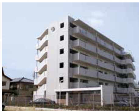
入居資格の見直しも検討

答 本市では、公営住宅法の趣旨を踏まえ、同居親族は原則、夫婦または親子としている。その一方で、兄弟姉妹であっても個々の事情に寄り添いながら入居資格の判断をしてきた。例えば、