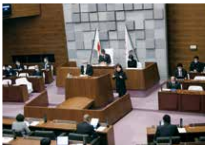
子どもを核としたまちを推進

本市は、全国に先駆け市独自に所得制限を設けず、子ども医療費を中学3年生まで無償化することにより、子育て世帯の経済的な負担を軽減しています。しかし、中学校卒業後は公的支援が少なく、子育てに係る経済的負担は大きく、コロナ禍