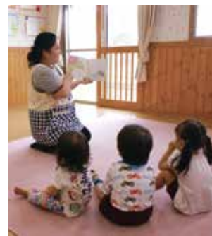
子どもに読み聞かせ(イメージ)

問 紙媒体だけでなく、スマートフォンで読めるアプリ「マチイロ」をもっとPRしてはどうか。 答 いつでも、どこでも見ることが出来る「マチイロ」は、閲覧者が昨年の実績で約2千人増えた。今後もさまざまな機会を捉え、さらにPRをしていく。