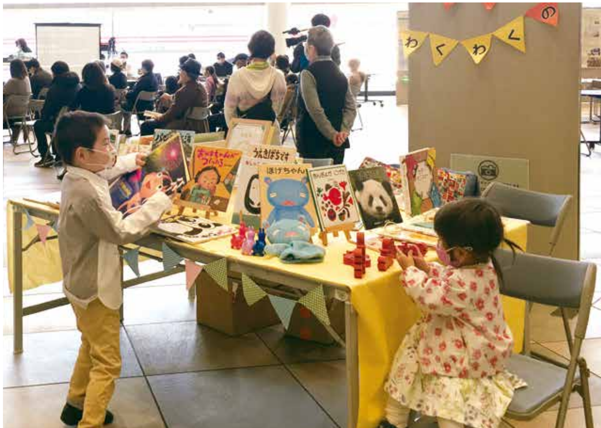
3月14日に、あかし市民広場で「まちライブラリーフェスタ」が行われました。「まちライブラリー」は、市内のカフェやオフィス、病院などに自由に使える本棚を設置し、本をきっかけに人がつながる活動です。