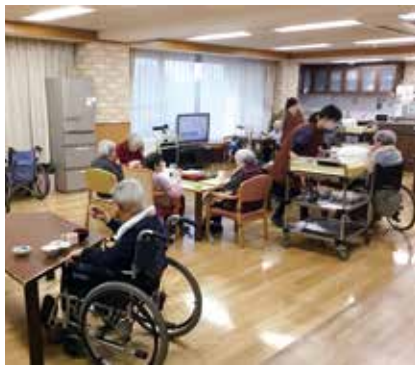
安心して暮らせる施設を

が増加すれば、介護保険サービスの利用者が増える。可能な限り保険料の上昇を抑制するため、介護予防や重度化の防止に取り組むとともに、将来を見越した同基金の適正な運用に努めていきたい。