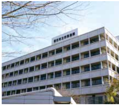
中軽症者病床を23床へ増床

市民病院では、重症患者を受け入れる医療機関の満床に伴う対応や、県からのさらなる病床確保の要請により、中軽症者の病床を20床から23床