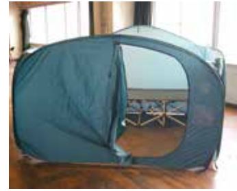
密を避ける個別テント

が不足した場合に備え民間レンタル事業者と協定を結んでいる。保管場所や管理上の課題はあるが、各避難所に一定数の個別テントが配備できるよう調整していきたい。