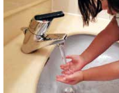
これからも良質な水の供給を

なっている。長期的には給水人口の減少による使用水量の減少が見込まれ、この状況が続くと将来的には水道料金を改定し、財源を確保する必要があるが、現状では値上げは考えていない。