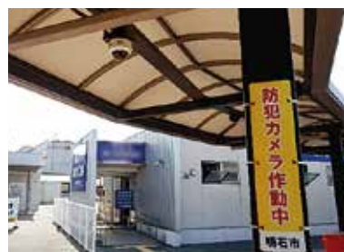
地域を見守る防犯カメラ

答 自治会等の地域団体が道路や公園など公共の場に防犯カメラを設置する場合、県は1カ所に8万円を補助するが、修理や更新は対象外となる。本市に補助制度はないが、まちづくり協議会等が設置する場合、県の制度と合わせ地域交付金等を活用することはできる。