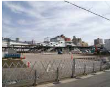
改札口ができる工場跡地

問 市は、JR西日本と西明石駅及び駅周辺におけるまちづくりの推進に関する協定を締結した。西明石地区の活性化に向けたまちづくりの事業内容等について聞く。