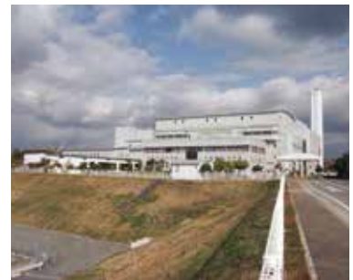
現在稼働中の明石クリーンセンター

画を策定し了承を得た。30年度には、周辺の自治会に新ごみ処理施設建設に向けた説明を行うとともに、生活環境影響調査を開始し、建設予定地周辺の地歴調査や土壌調査などの基礎調査を行った。令和元年度から、新ごみ処理施設整備基本計画の策定に着手した。可燃ごみは、熱処理方式での処理、破碎選別施設も併設することが望ましいと、技術的専門性の高い内容を協議する技術支援会議から助言を受けている。現在は、規模や事業手法などを検討し、再生可能エネルギーの導入など環境にやさしい施設を目指し、基本計画の策定に向けて取り組んでいる。