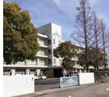
時代に応じた魅力ある学校に

答 介護人材については、県内において令和7年度に約2万人が不足すると予想されるなど、人材確保と育成は喫緊の課題である。福祉の基礎を学び、介護等の資格を取得した若い人材を地域で将来にわたって安定的に確保するため、明石商業高校に福祉教育を行う学科を開設することは有効であり、関係団体からも強い要望がある。