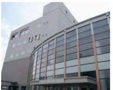
保健所に予約相談窓口を常設

降から65歳以上の高齢者と高齢者施設の従事者、続いて基礎疾患がある人へと順次、対象者を拡大していく。対象者は16歳以上で、接種は強制ではなく努力義務となっており、妊娠中の人は努力義務も適用されない。接種を受けるには、市から接種券が届いた後、事前予約を行う必要がある。予約相談体制は、コールセンターや保健所とあかし市民広場に開設する窓口、LINEなどを活用し充実させたい。