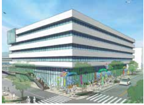
災害時に迅速な対応ができる設計へ

答 新庁舎の基本設計計画の素案では、地震や津波等の発生時にも庁舎としての機能が継続でき、災害に対して迅速な対応が可能なることを設計コンセプトに掲げている。具体的には、免震構造の採用や地盤のかさ上げ等