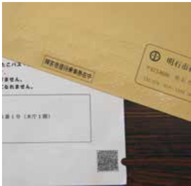
希望者には封筒に点字表記

希望者には封筒に点字表記を貼り、希望に添った点字での説明文や、音声CDを同封した。今後も新たに開発された情報ツールなどを研究し、状況に応じた情報保障を進めていく。