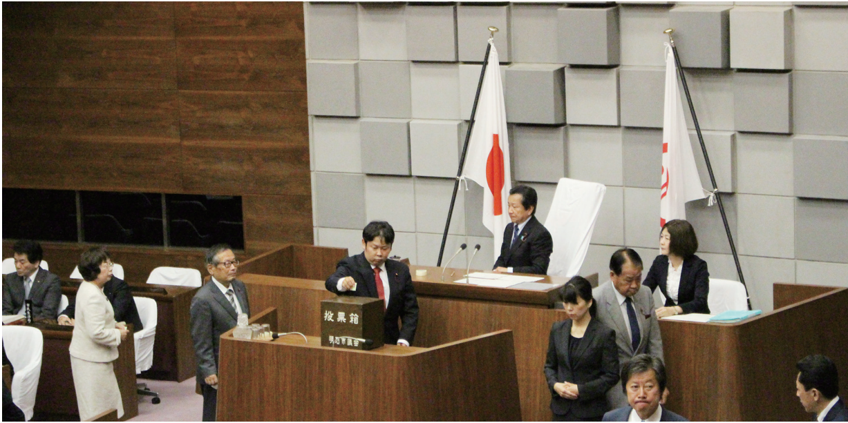
新議長のもとで行われた副議長選挙