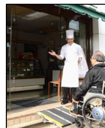
（制度を活用したスロープの設置）