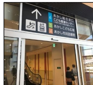
(駅前再開発ビル案内)