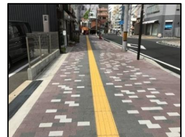
(視覚障害者誘導用ブロック)