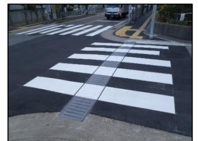
(総合福祉センター周辺のエスコートゾーン)