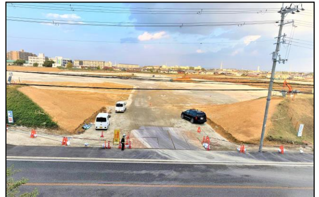
工事施工状況写真

なお、魚住地区のタウンミーティングや地元説明会でいただいた意見や要望を踏まえ、施設の名称や利用方法について一部変更します。