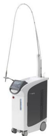
エルビウム・ヤグレーザー