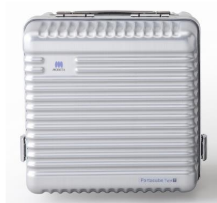
可搬式歯科用ユニット