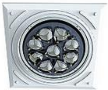
汎用歯科用照明器