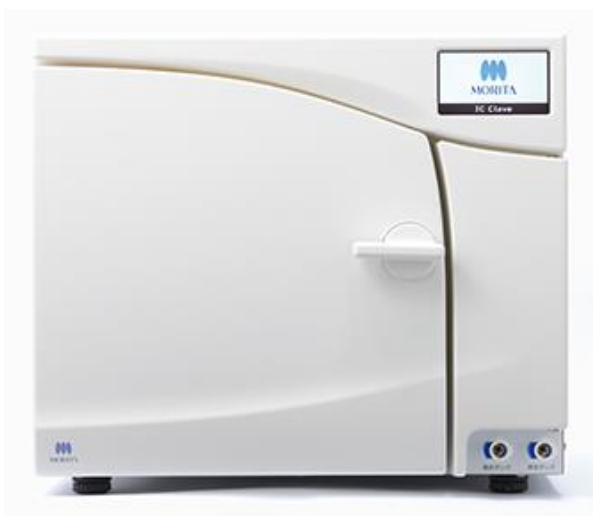
歯科用小型包装用高压蒸气灭菌器