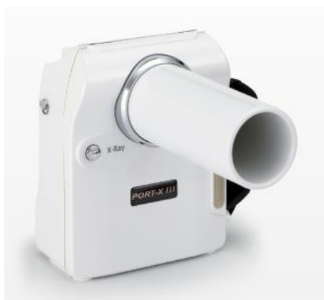
アナログ式口外汎用歯科X線診断装置