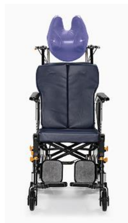
車椅子 (ヘッドレスト含む)