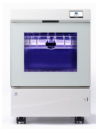
歯科用器具除染用洗净器