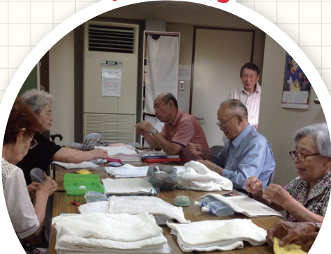
つどいの場・活動できる場をつくる、紹介するなど