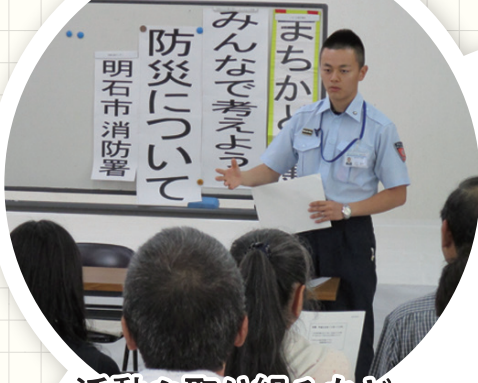
活動や取り組みなど