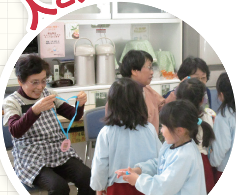
地域住民同士・専門職同士をつなぐなど