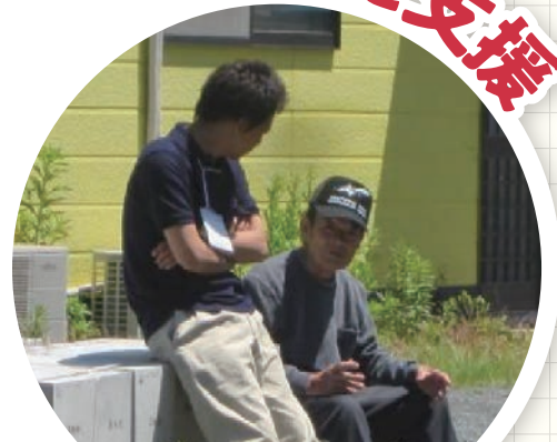
福祉専門職や 介護サービスの紹介など