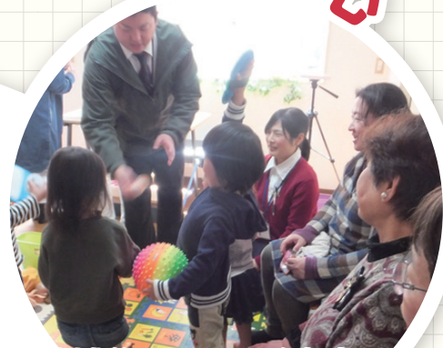
地域住民の思いを把握する・地域の将来像を共有するなど