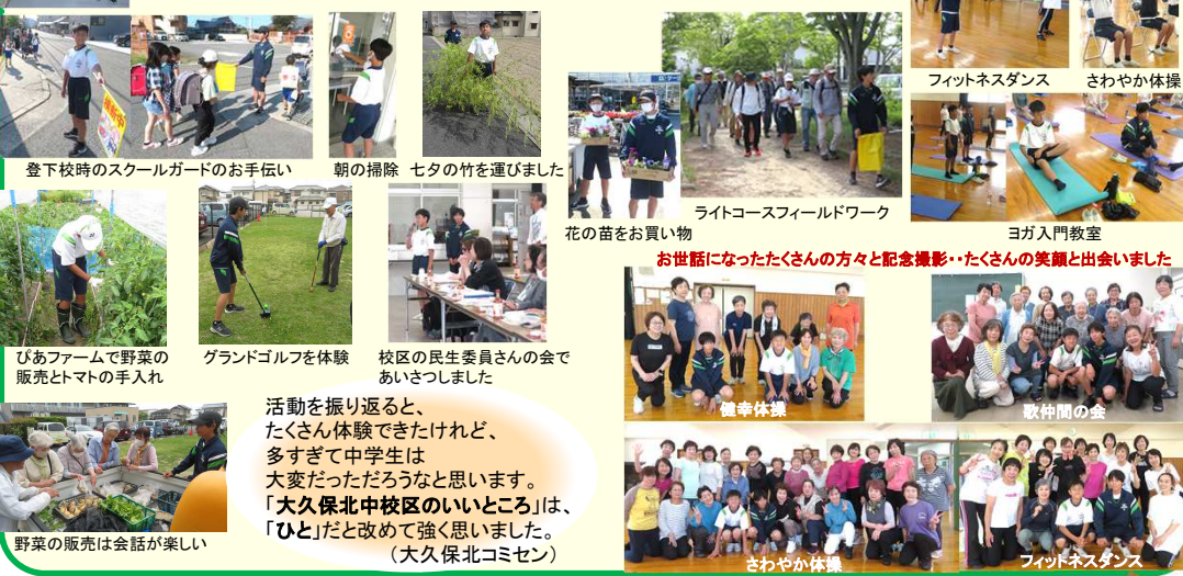
登下校時のスクールガードのお手伝い 朝の掃除 七夕の竹運びました

コミセンとしては、来てくれた生徒たちに大久保北中校区の素晴らしさを体験してもらいたくて、校区のいろいろな場所に出向き、たくさんの方と出会い、ふれあい、そして一緒に活動できるようなプログラムを考えました。