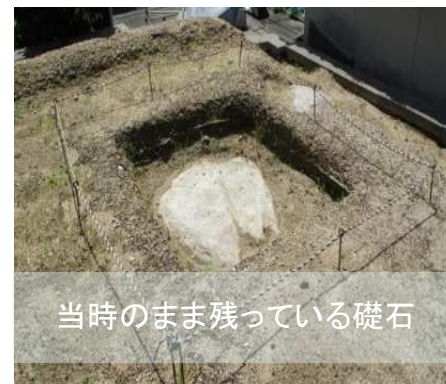
当時のまま残っている礎石