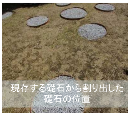
現存する礎石から割り出した 礎石の位置