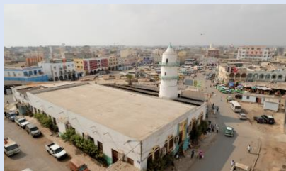
ランボー広場(市内中心部)