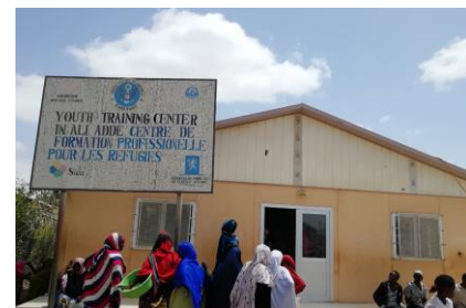
キャンプ内職業訓練所外観

キャンプ内小学校の授業の様子 ジブチでは、小学生(難民含む)に制服を配布し、着用させている