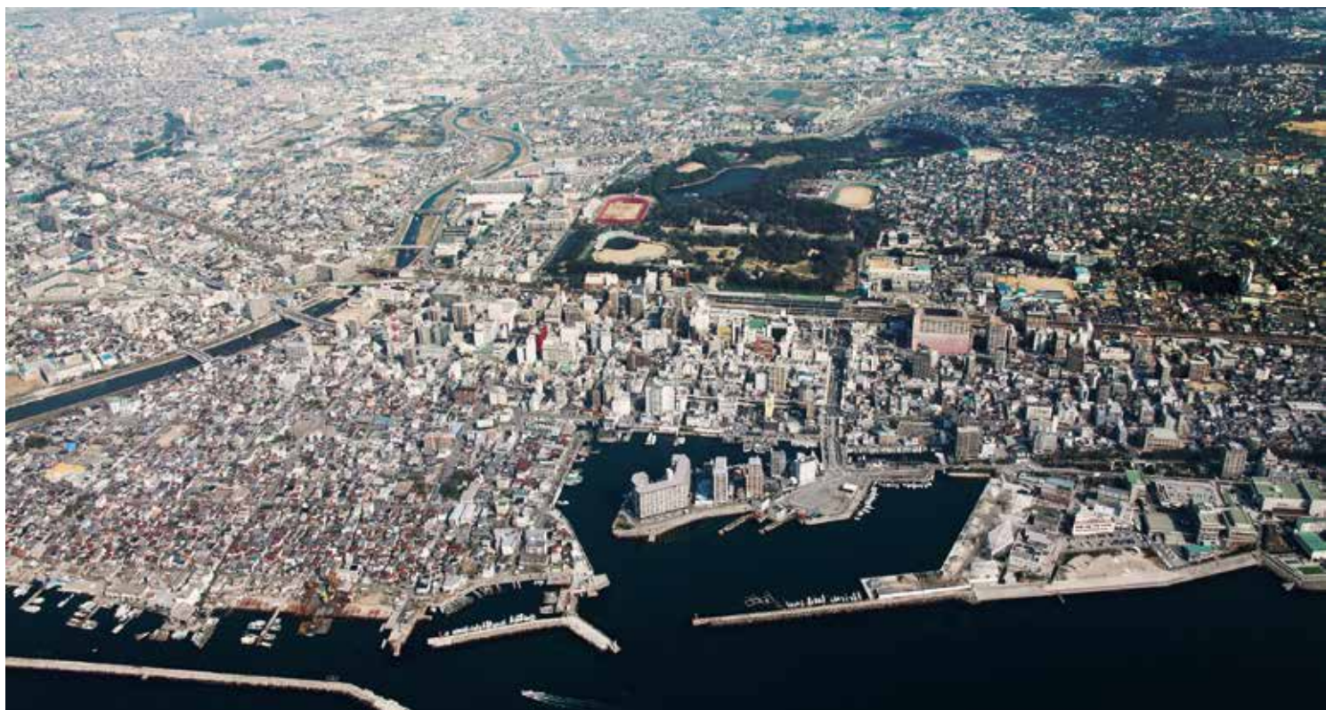
从明石市上空俯瞰明石市区