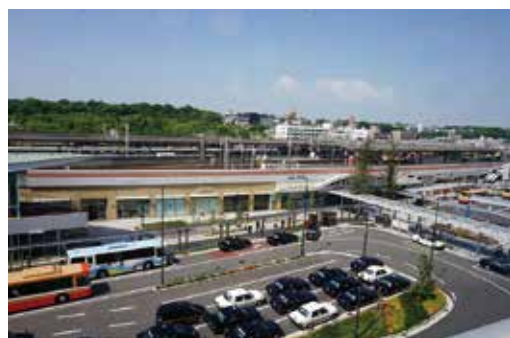
市的大门口 - 明石火车站