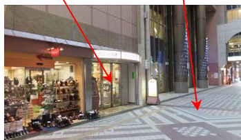
アトリウムコート