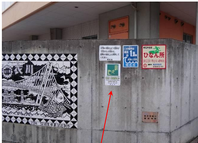
津波避難ビル標識